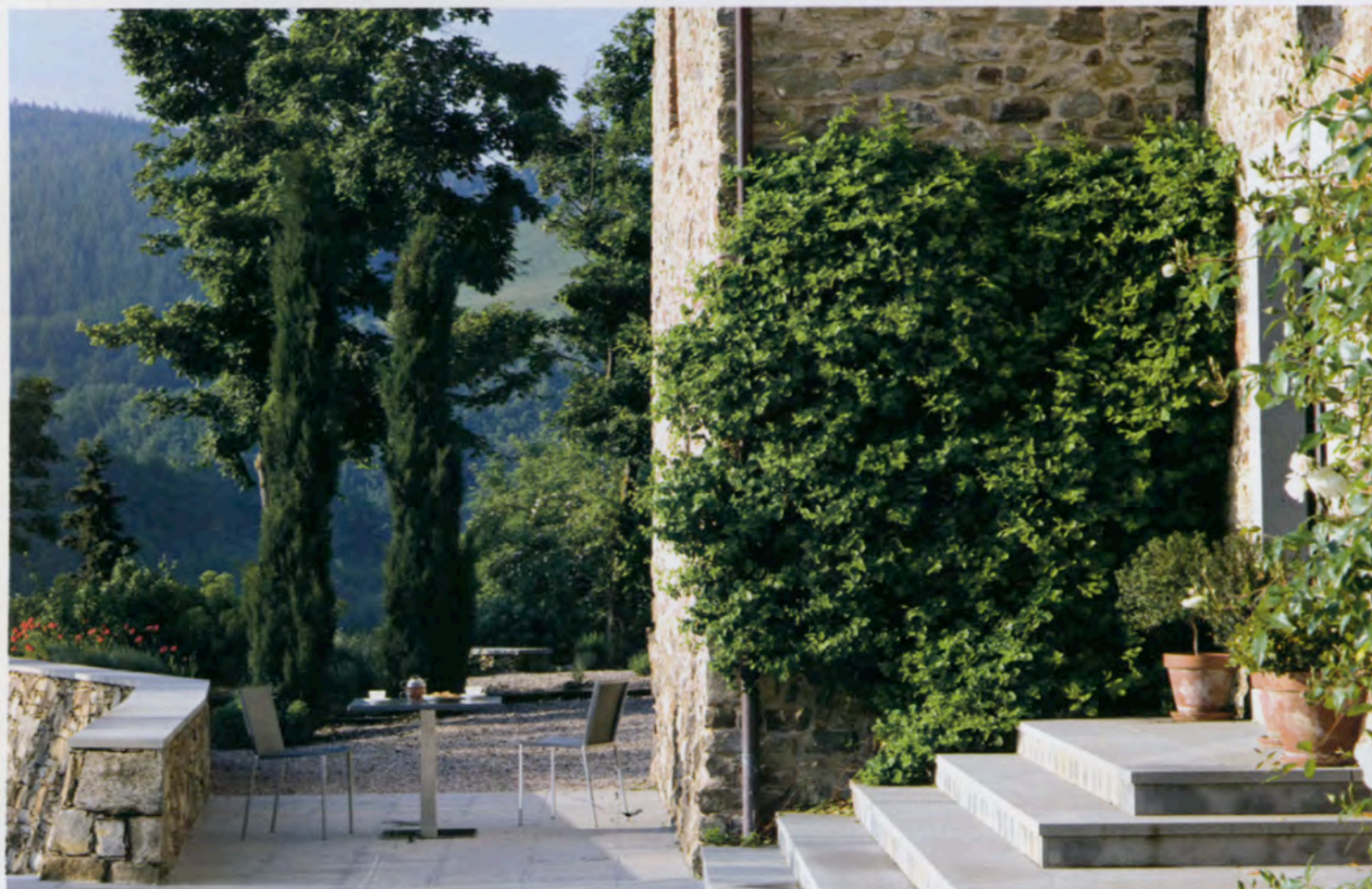
Dalle terrazze sul crinale si gode la vista del panorama